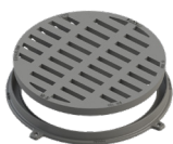
Redonda 50 D400