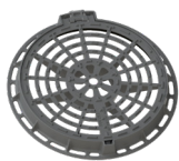
Redonda 60 D400 c/ Eixo e Dobradiça