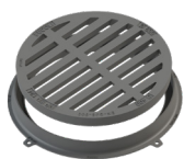
Redonda 60 D400