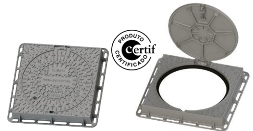
99900065 / 99900068

Sendo um dos principais objectivos da nossa empresa o desenvolvimento e aperfeiçoamento dos nossos produtos, reservamo-nos no direito de fornecer quaisquer outros que possam diferir ligeiramente dos descritos e ilustrados nesta publicação.