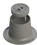
99900110 / 99900026