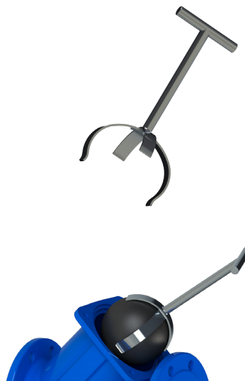
Remoção da bola