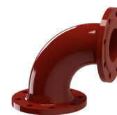
DN 700 a DN 1000