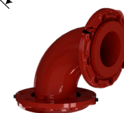
DN 40 a DN 600