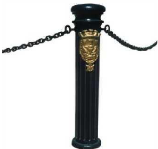
Imagem apenas ilustrativa Image only illustrative

Material: Ferro Fundido Dúctil EN-GJS-500-7