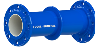
Flange passa-muros fixa de DN 250 a DN 800