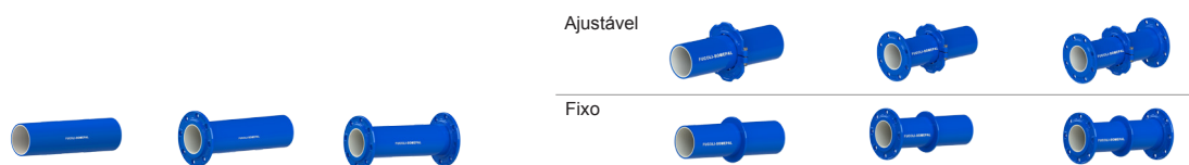
Código dos 9 modelos disponíveis